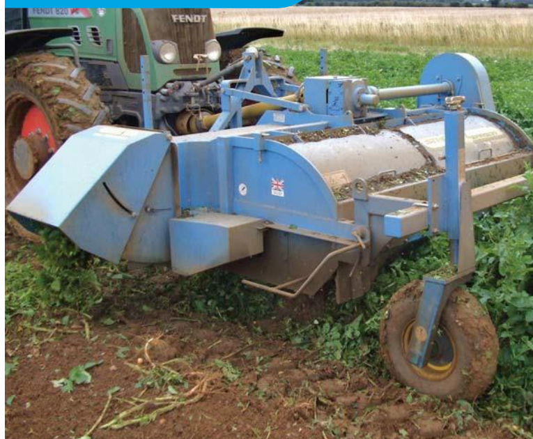
Мощное всасывание эффек. обраб. вершков